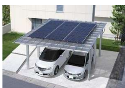
太陽光発電搭載型カーポート