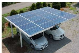
太陽光発電一体型カーポート